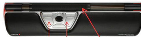
Boutons dédiés Roller bar